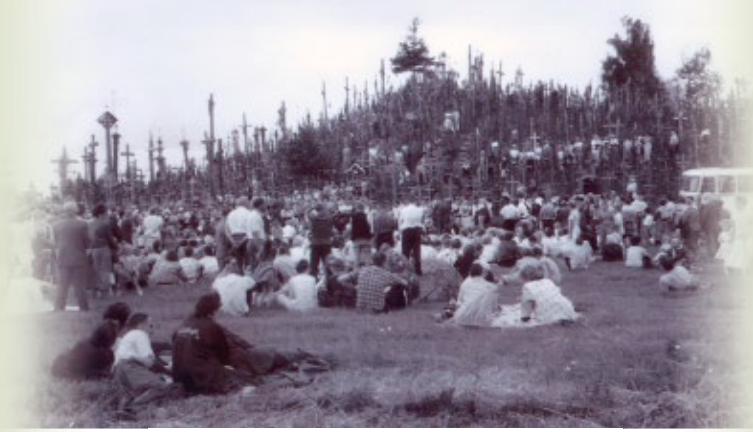
Pirmieji atkurti kryžius atkairiai 1997 m. liepos 20 d.