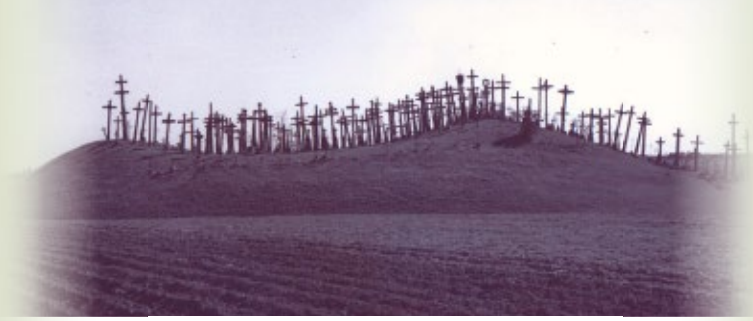
Nuotr. autorius S. Ivanauskas, 1945 m.