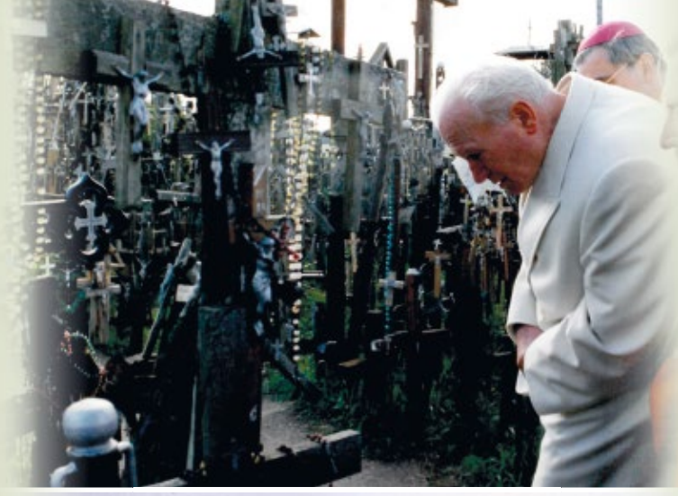
Papieżius Jonas Paulius II 1993 m. rugsejo 7 d.