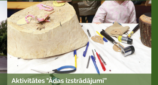
Aktivitātes "Ādas izstrādājumi"