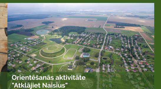
Orientēšanās aktivitāte "Atklājiet Naisjus"