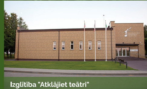
Izglītība "Atklājiet teātri"